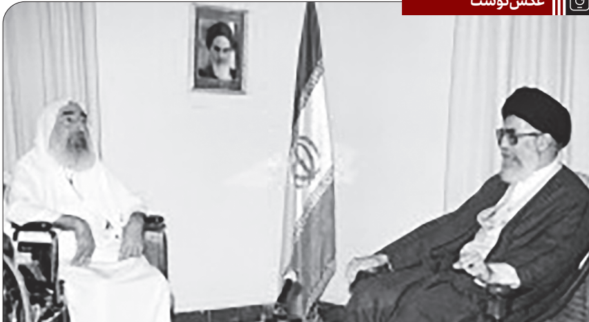
دیدار شیخ احمد یاسین، بنیانگذار جنبش مقاومت اسلامی فلسطین حماس با رهبران انقلاب اسلامی، ۱۳۷۷/۲/۱۲