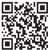
دراقت نشان "ماه فلسطین" از طریق رمزین

شعار فوق برگرفته از بیانات حضرت آیت الله خامنه ای درباره روز قدس و ماه مبارک رمضان است که چندین بار در سخنان ایشان مورد تأکید قرار گرفته؛ از جمله در سوم خرداد ۱۳۶۴ که فرمودند: «ماه رمضان برای ما ماه فلسطین است. می دانید جمعه ای آخر این ماه را امام عزیز ما روز قدس نامگذاری کردند و ما همه ای ماه رمضان می خواهیم مردم خودمان و ملت های منطقه را آماده کنیم تا در روز قدس فریاد یک آهنگ خودشان را بر علیه متجاوزان صهیونیسم بلند کنند و حرف خودشان را بزنند و دل صهیونیست ها و حامیان شان را بلرزاند؛ این ماه رمضان ماست.»